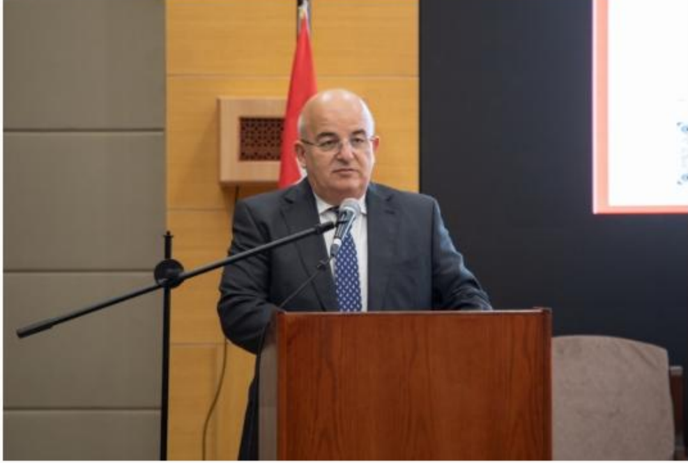
الشريط الإخباري :

خبر و صورة | 2026-04-02 | 01:33 pm - الخميس