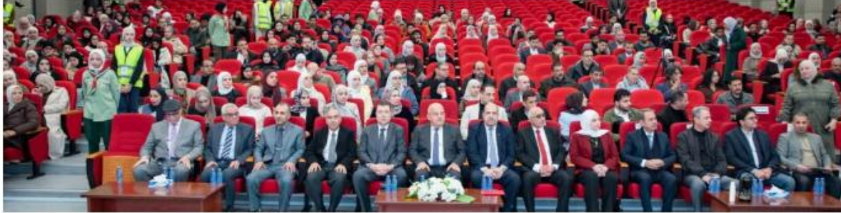
وكالة الجامعة الإخبارية

رعى رئيس الجامعة الهاشمية الأستاذ الدكتور خالد الحيارى فعاليات اليوم العلمي لقسم الكيمياء في كلية العلوم، بحضور نواب الرئيس وعمداء الكليات وأعضاء الهيئتين الأكاديمية والإدارية، وعدد من الخبراء والمختصين وممثلي الشركات الصناعية والكيميائية، وجمع من الطلبة، وجاءت الفعالية لتأكيد أهمية ربط المعرفة النظرية بالتطبيق العملي واستشراف مستقبل علوم الكيمياء في ظل التحولات العلمية والتقنية المتسارعة،